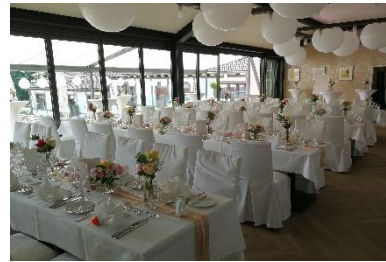
5 x lange Tischtafeln bis maximal 70 Personen