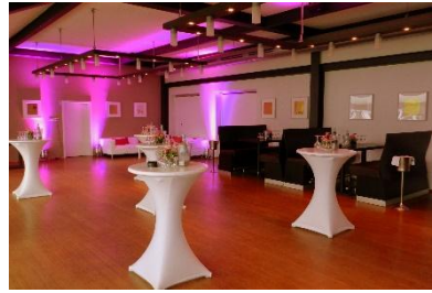
Restaurant II mit lockerer Bestuhlung