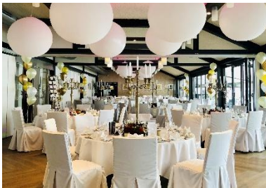
Runde Tische à 9 Personen