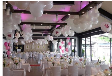
Tischtafeln mit Mittelgang