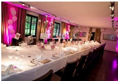
Lange breite Tischtafel bis maximal 34 Personen