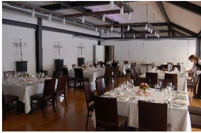
maximal 6 x Blocktische mit 8 Personen