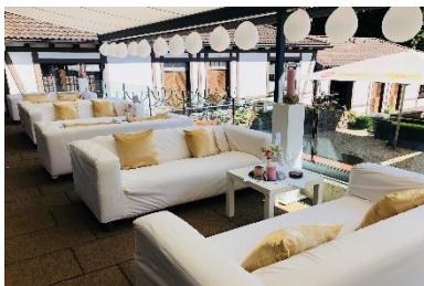
Terrasse I & II mit Sofas