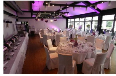
Runde Tische bis max. 54 Personen