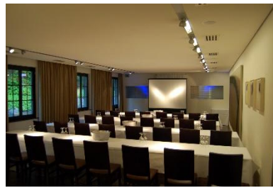
Parlamentarisch bis maximal 32 Personen