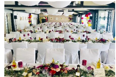
Lange schmale Tischtafeln je Tafel 16 Personen