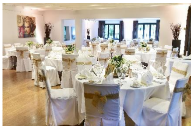
Runde- & ovale Tische bis maximal 105 Personen