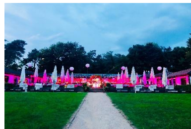
Außen-Aufnahme Wiese & Biergarten