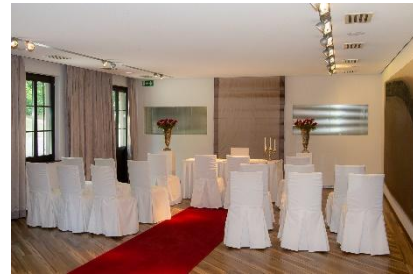
Freie Trauung bis maximal 50 Person stehend