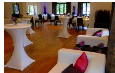
Stehltische, Sofas, Buffet, 5 x runde Tische