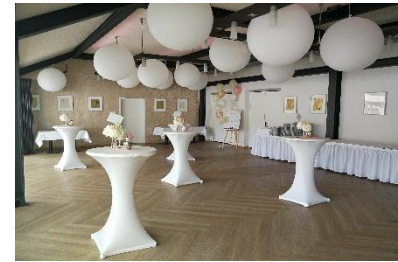
Empfangs- & Buffetraum später Tanzfläche