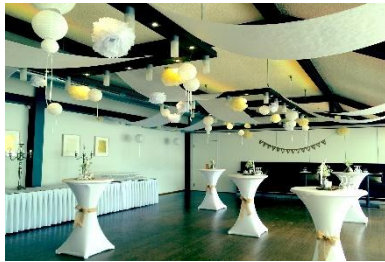
Restaurant II mit Buffet und Hochbänken