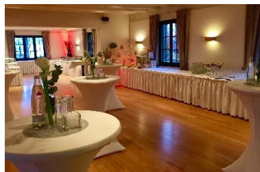
Empfangs- & Buffetraum