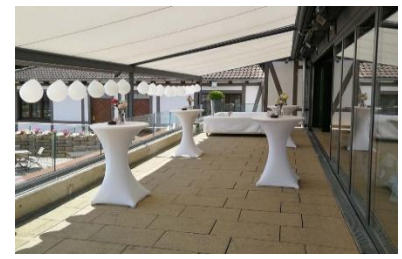
Terrasse I & II mit Stehtischen & Sofas