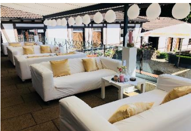
Terrasse I & II mit Sofas