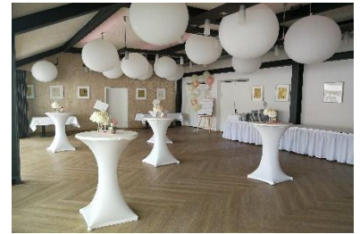
Empfangs- & Buffetraum später Tanzfläche