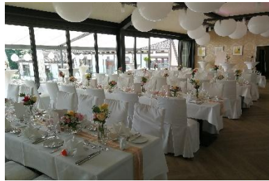
5 x lange Tischtafeln bis maximal 70 Personen