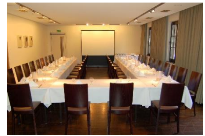
U-Form bis maximal 36 Personen (innen & außen bestuhlt)