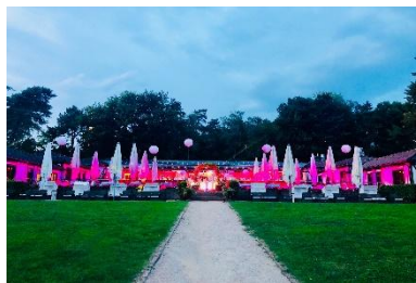
Außen-Aufnahme Wiese & Biergarten