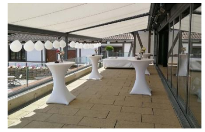
Terrasse I & II mit Stehtischen & Sofas