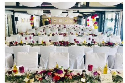
Lange schmale Tischtafeln je Tafel 16 Personen