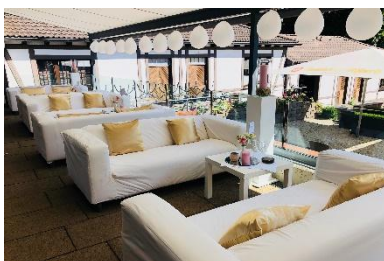
Terrasse I & II mit Sofas