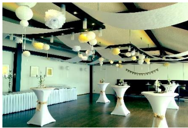
Restaurant II mit Buffet und Hochbänken